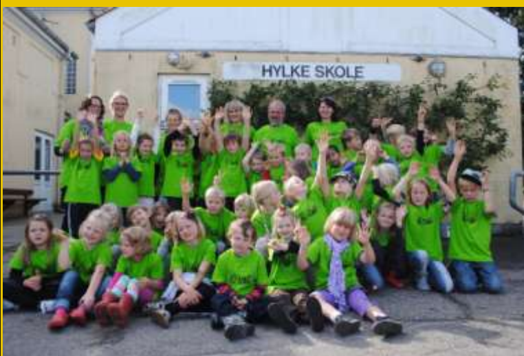
Hylke Skole 25 år